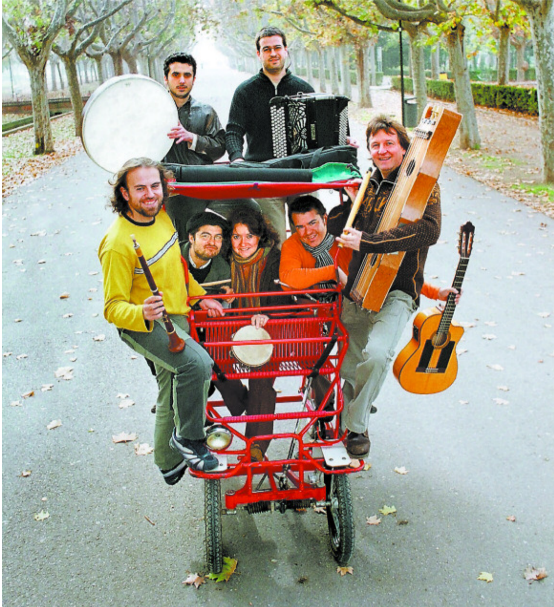
Los integrantes del grupo musical aragonés Biella Nuei.

Bajén nació hace 41 años en Elgoibar (Guipúzcoa), pero reside en la capital maña desde chiquillo. Se crió escuchando folclor irlandés, tropicalismo brasileño y las colecciones del mítico sello Guimbarda. Eran unos tiempos